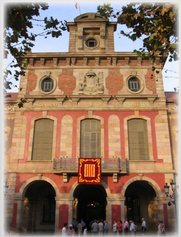
Parlement de Catalogne, Barcelone

Doctorant, Université Paris II Panthéon-Assas