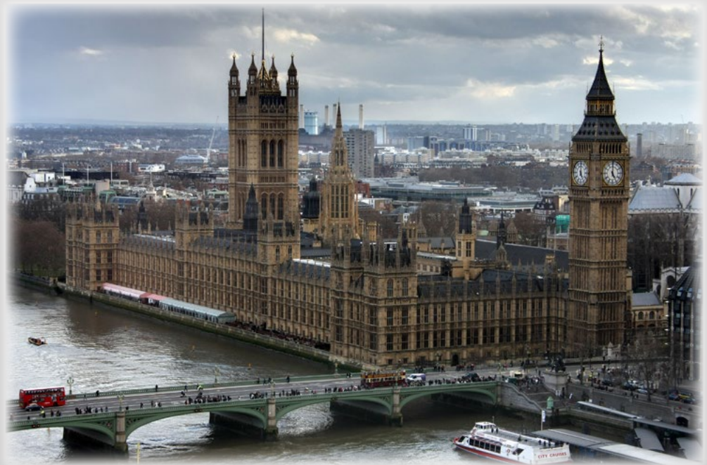
Palais de Westminster, Londres

Professeur, Université Jean-Monnet de Saint Étienne / Université de Lyon